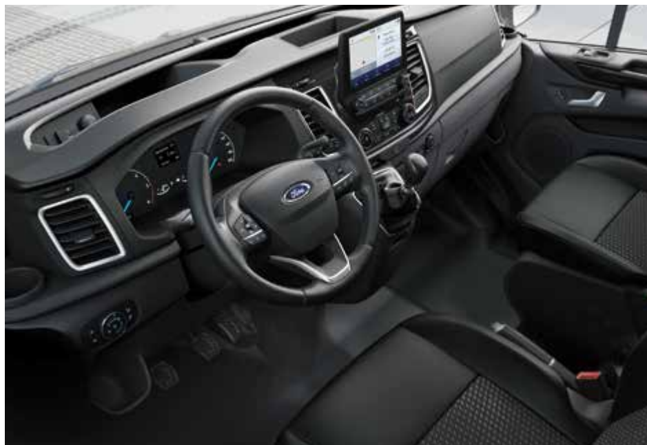
Ford Transit Custom Kombi Sport