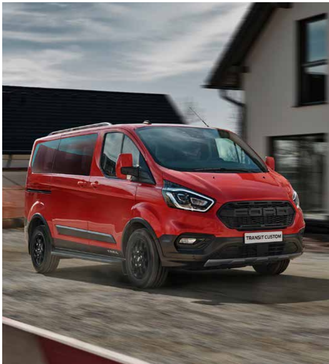
Ford Transit Custom Kombi Trail w kolorze Race Red (bez dopłaty)