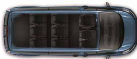
Ładowność do 1242 kg (L2) | 9 miejsc

L1 = krótki rozstaw osi, L2 = długi rozstaw osi, H1 = niski dach, H2 = wysoki dach. Wszystkie wymiary (w mm) dotyczą modeli z podstawowym wyposażeniem i nie uwzględniają wyposażenia dodatkowego. Możliwe niewielkie odchylenia w ramach tolerancji produkcyjnej. Wymiary wysokości określają zakres od minimum (dla wersji o najniższej ładowności z pełnym obciążeniem) do maksimum (dla wersji o najwyższej ładowności bez obciążenia). Ilustracje na tych stronach mają wyłącznie charakter poglądowy.