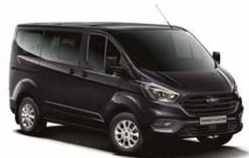
AGATE BLACK - lakier metalizowany 2 500,-