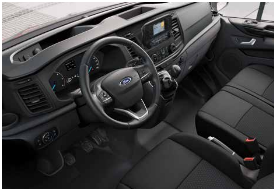
Ford Transit Custom Kombi Trend