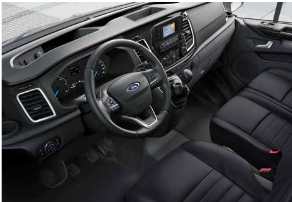
Ford Transit Custom Kombi Trail