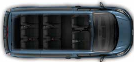
Ładowność do 1288 kg (L1) | 9 miejsc