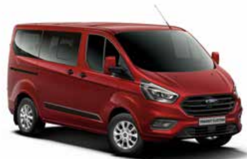
DARK CARMINE RED - lakier metalizowany 2 500,-