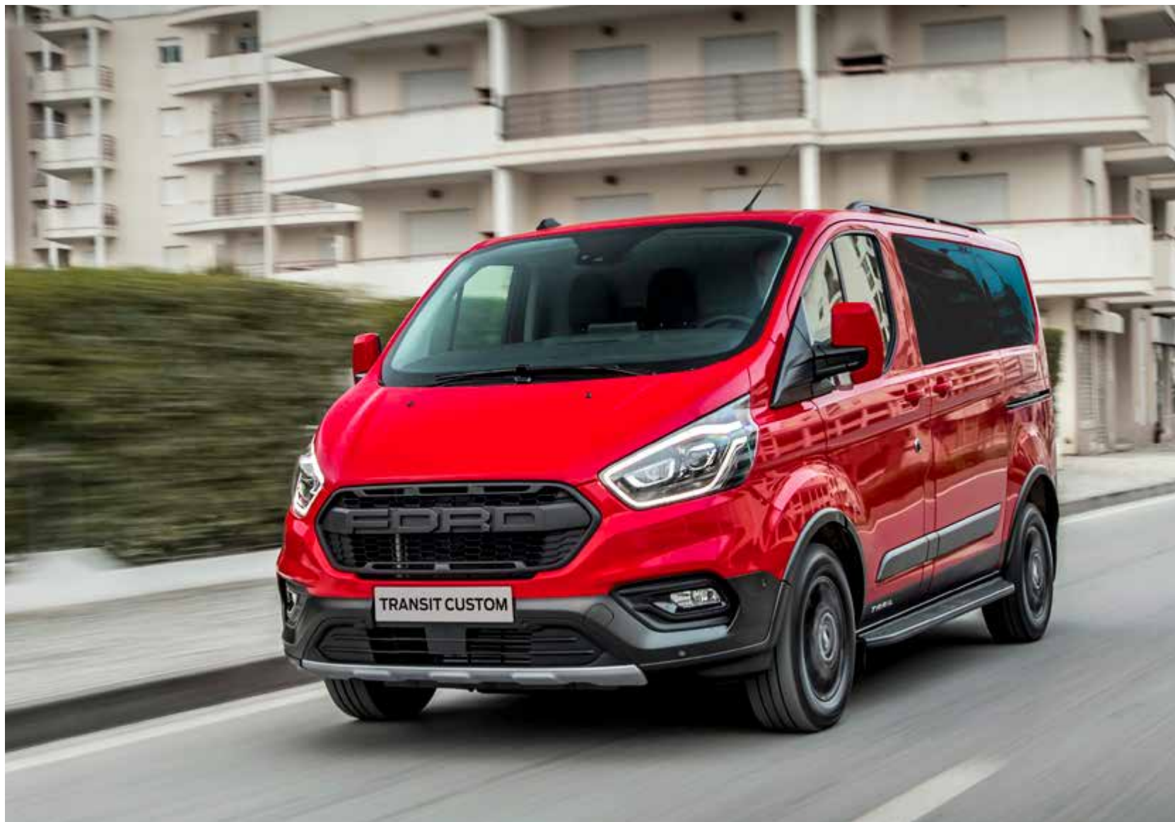
Ford Transit Custom Kombi Trail z opcjonalnym wyposażeniem