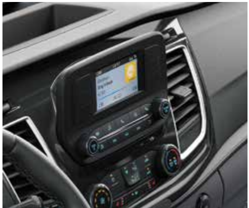
Radio My Connection z DAB+ z 4,2" kolorowym wyświetlaczem