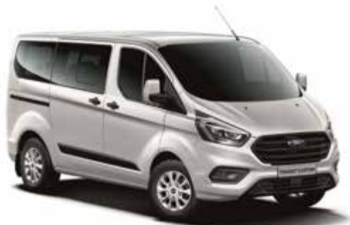
MOONDUST SILVER - lakier metalizowany 2 500,-