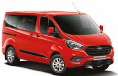
RACE RED - lakier zwykły bez dopłaty