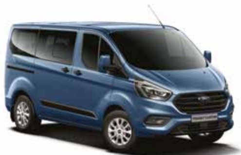
CHROME BLUE - lakier metalizowany 2 500,-