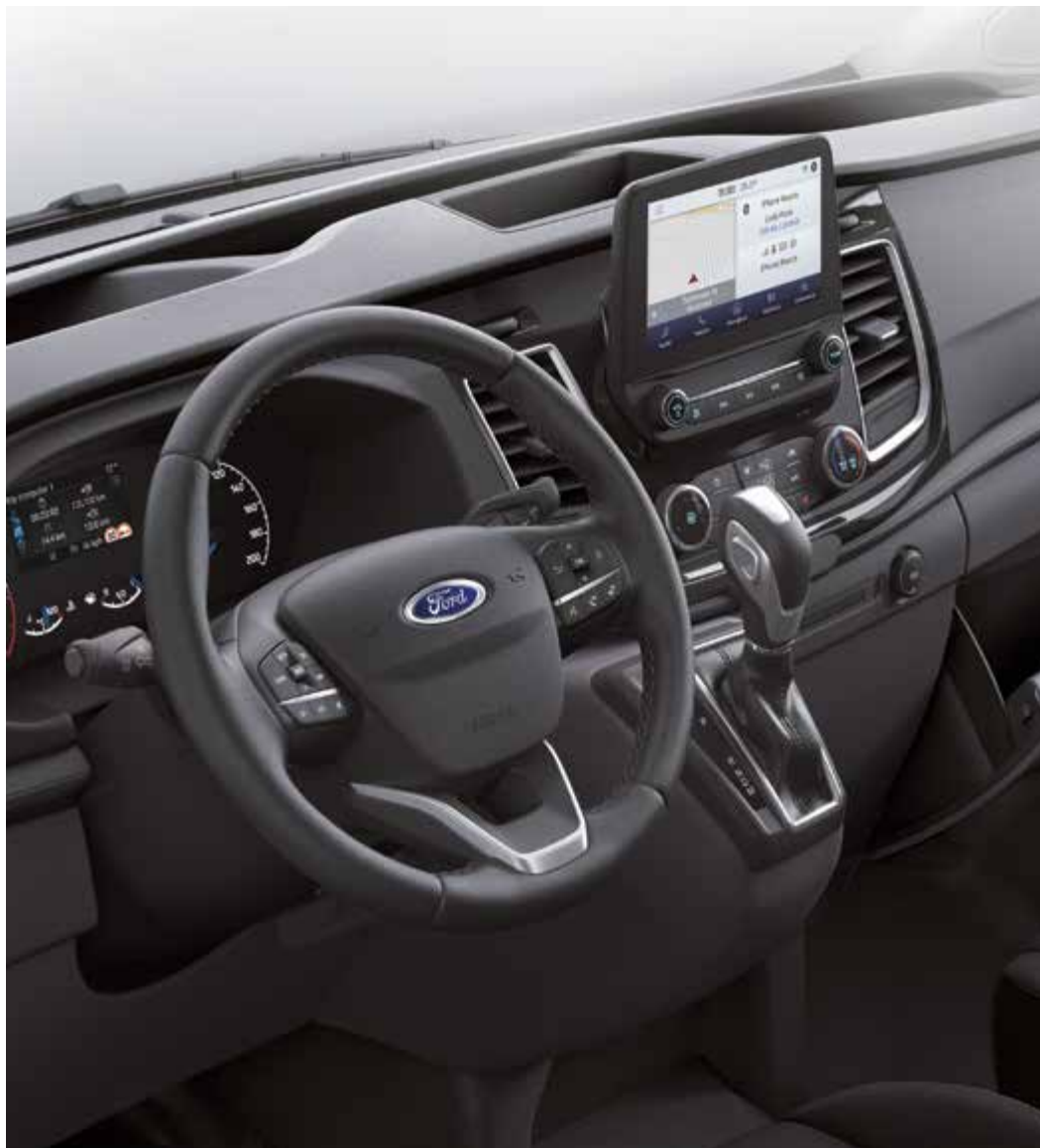
Ford Transit Custom z systemem nawigacji satelitarnej (ICE PACK 25) (opcja)