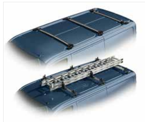
Zintegrowany bagażnik dachowy - składany