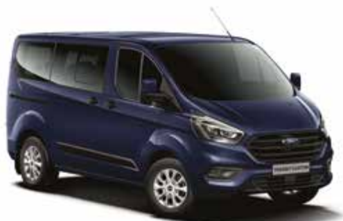
BLAZER BLUE - lakier zwykły bez dopłaty | niedostępny dla wersji Trail