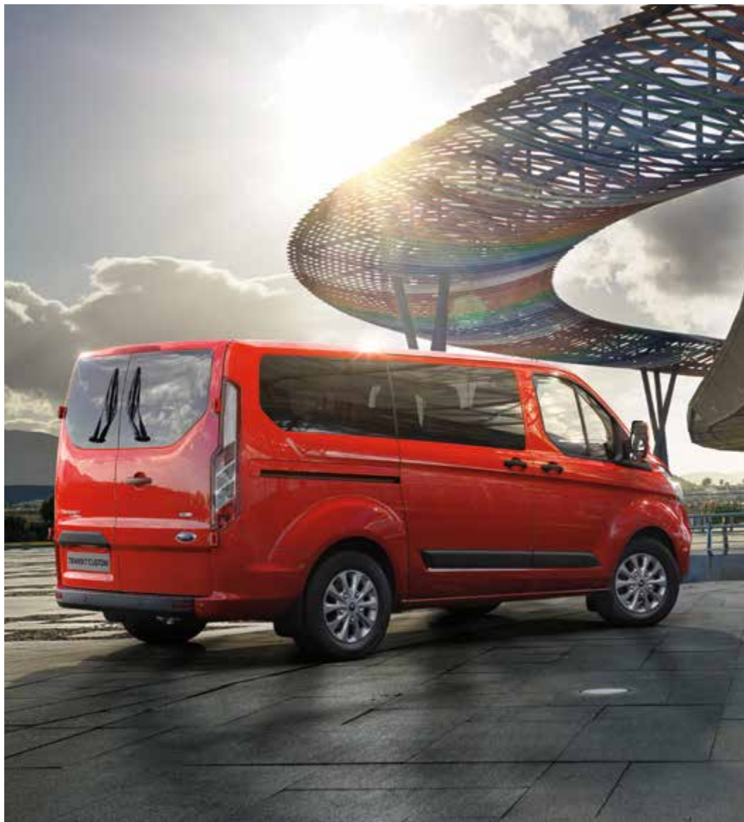
Ford Transit Custom Kombi Trend L1H1 w kolorze Race Red (opcja) i 16" obręczami kół ze stopów lekkich (opcja)