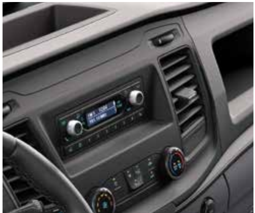
Radio w standardzie 1DIN z DAB+