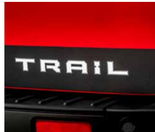
Ochronne naklejki z napisem „TRAIL” po bokach i z tył