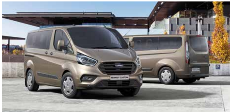
Ford Transit Custom Kombi Trend w kolorze Diffused Silver (opcja)