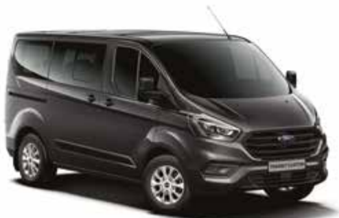
MAGNETIC GREY - lakier metalizowany 2 500,- | niedostępny dla wersji Trail