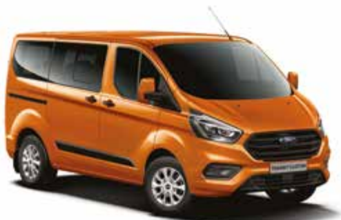
ORANGE GLOW - lakier metalizowany 2 500,- | niedostępny dla wersji Trail