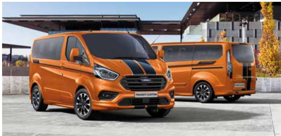
Ford Transit Custom Kombi Sport w kolorze Orange Glow (bez dopłaty)