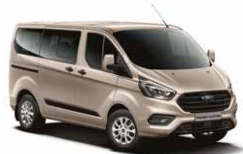
DIFFUSED SILVER - lakier metalizowany 2 500,- | niedostępny dla wersji Trail