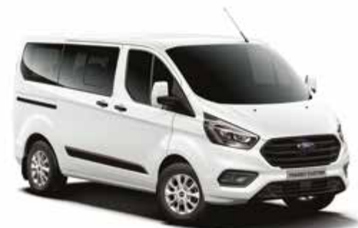
FROZEN WHITE - lakier zwykły bez dopłaty