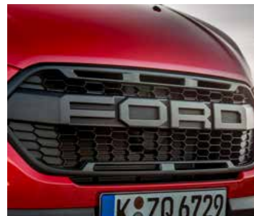
Unikalna krata wlotu powietrza z napisem „F O R D”