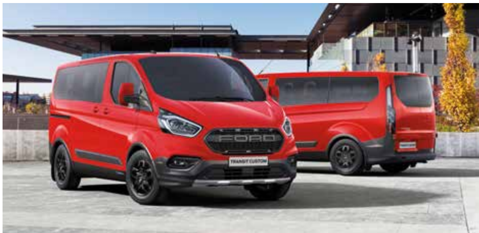
Ford Transit Custom Kombi Trail w kolorze Race Red (bez dopłaty)