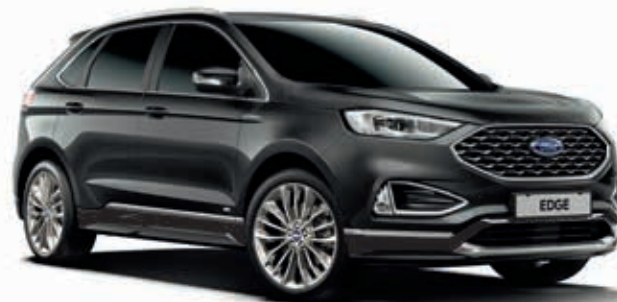
Magnetic Grey Lakier metalizowany bez dopłaty