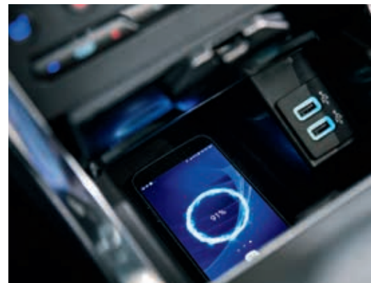
Ładowarka bezprzewodowa umożliwia ładowanie kompatybilnych urządzeń bez użycia przewodu Standard ze skrzynią A8