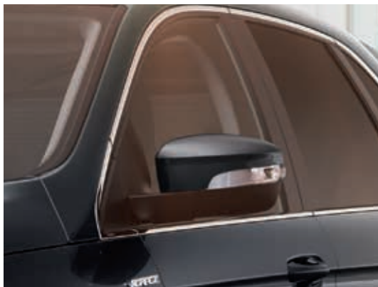
Lusterka boczne sterowane, podgrzewane i składane elektrycznie