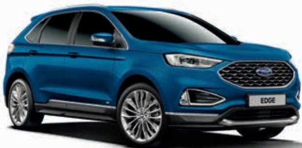
Atlas Blue Lakier metalizowany bez dopłaty