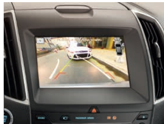
Kamera ułatwiająca parkowanie tyłem ze spryskiwaczem Standard

□ wyposażenie dostępne tylko w pakiecie lub z inną opcją