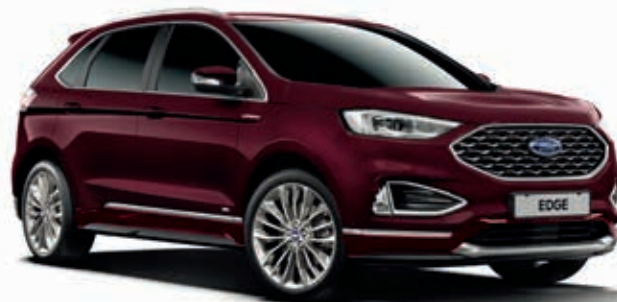
Burgundy Velvet Lakier metalizowany specjalny 1600,-