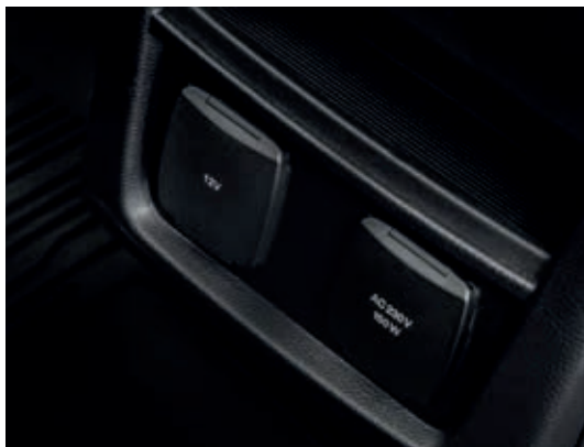
Gniazdko 230V umożliwia korzystanie z urządzeń elektronicznych, takich jak np. laptop w czasie podróży, bez obawy o rozładowanie baterii.

Opcja usuwa relingi z wyposażenia standardowego