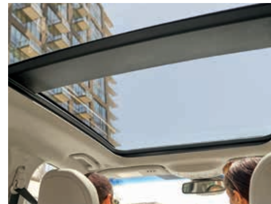
Dach panoramiczny otwierany , z roletą przeciwsłoneczną sterowaną elektrycznie oraz filtrem przeciwsłonecznym IR.