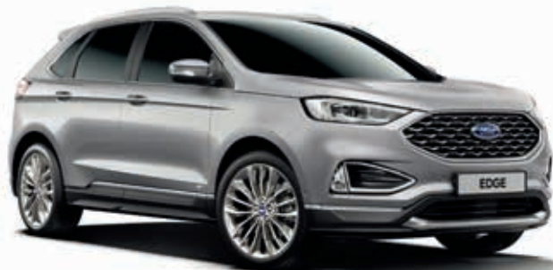
Iconic Silver Lakier metalizowany bez dopłaty