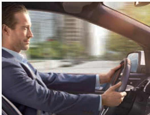
Układ Active Noise Control

Układ niweluje niepożądane hałasy w kabinie. Trzy ukryte mikrofony wychwytyują hałas w tle, który jest następnie tłumiony za pomocą odwróconych fal dźwiękowych emitowanych przez głośniki systemu audio.