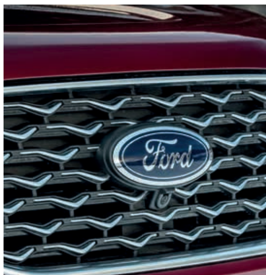
Przedni grill w unikatowej stylizacji Vignale