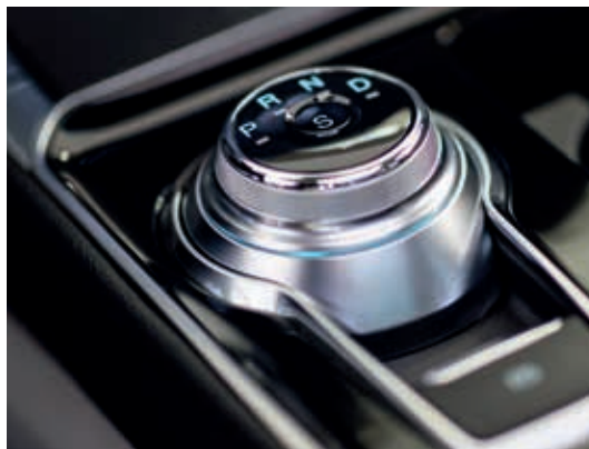
E-shifter - pokrętko sterowania automatyczną skrzynią biegów umożliwia szybkie i łatwe wybieranie trybów przekładni poprzez jego obrócenie.