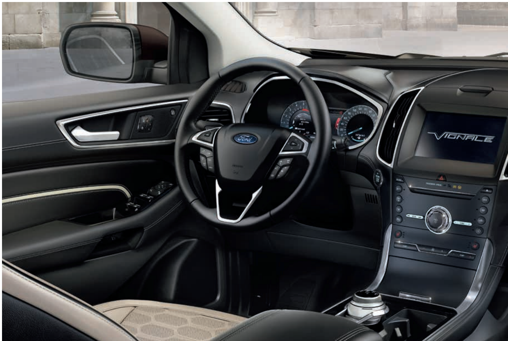
Nowy Ford Edge Vignale z jasną tapicerką Lux (bez dopłaty)