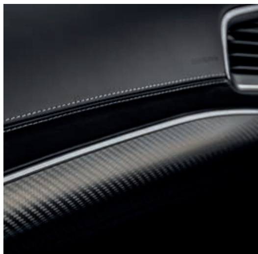
Deska rozdzielcza wykończona skórą