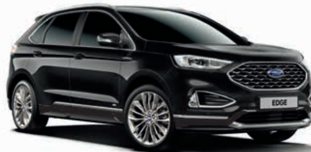
Agate Black Lakier metalizowany bez dopłaty