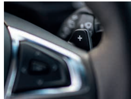
Manetki do zmiany biegów

Dostępne z automatyczną skrzynią biegów manetki przy kierownicy umożliwiają samodzielną zmianę biegów.