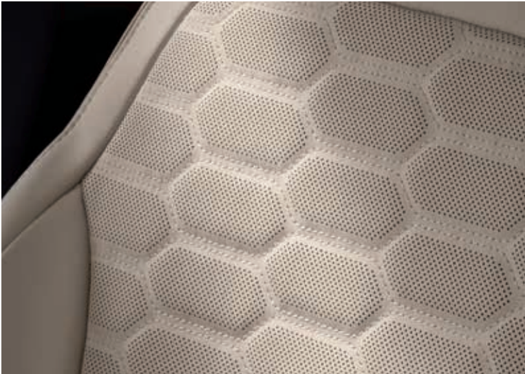
Tapicerka skórzana, perforowana Lux (jasna)