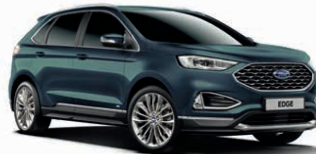
Persian Green Lakier metalizowany bez dopłaty