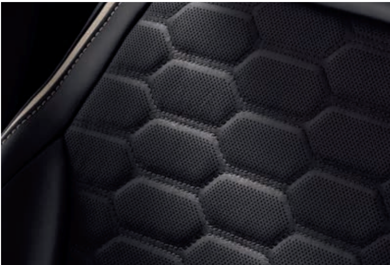
Tapicerka skórzana, perforowana Lux (ciemna)

● wyposażenie standardowe □ wyposażenie dostępne tylko w pakiecie lub z inną opcją