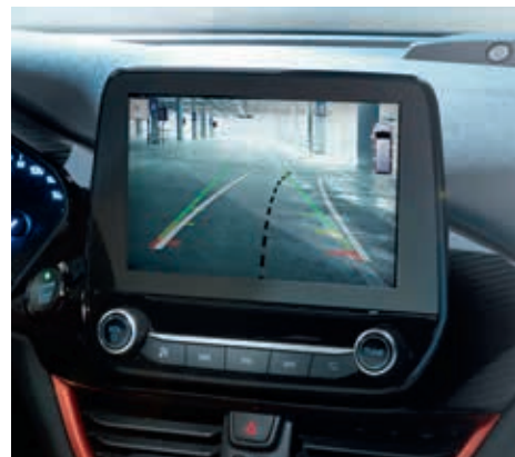
Kamera ułatwiająca parkowanie tyłem

□ wyposażenie dostępne tylko w pakiecie lub z inną opcją