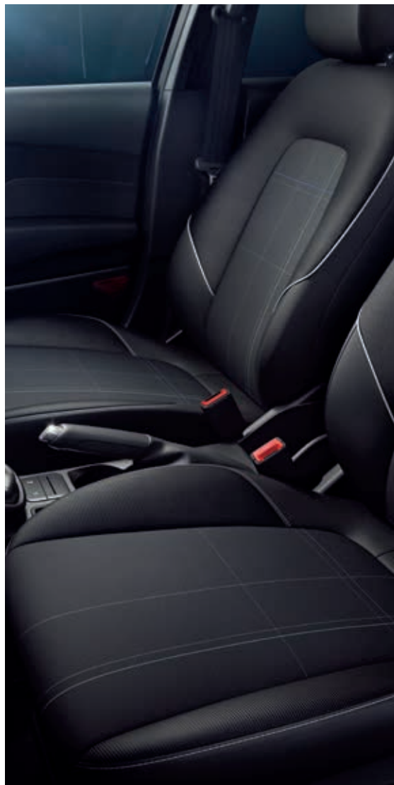
Tapicerka materiałowa Tira (3JWZH)