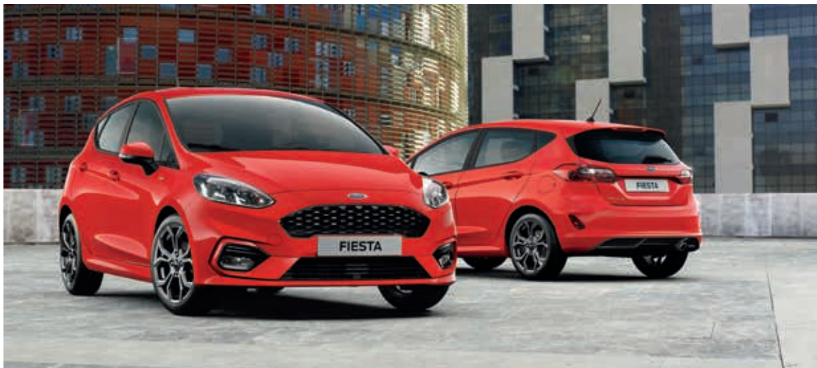
Ford Fiesta ST-Line w kolorze Race Red (opcja)