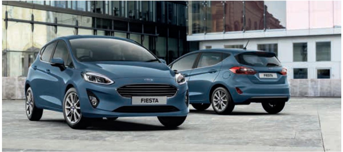
Ford Fiesta Titanium w kolorze Chrome Blue (opcja)