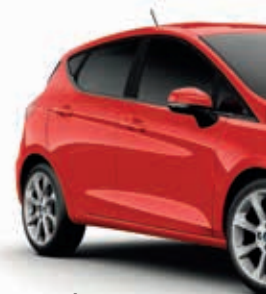
Race Red Lakier zwykły 600,-