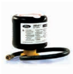
Zestaw do naprawy ogumienia

TREND, SYNC EDITION, TITANIUM, ST-LINE standard