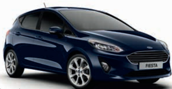
Blazer Blue Lakier zwykły bez dopłaty