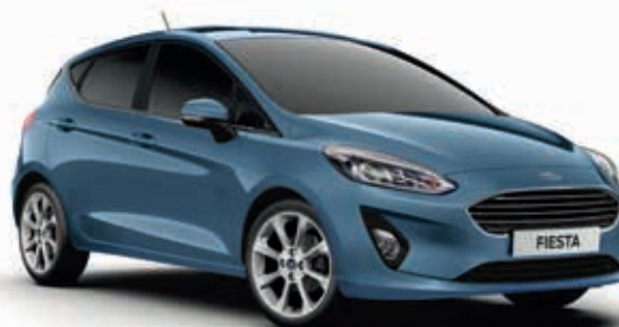
Chrome Blue Lakier metalizowany 1 800,-