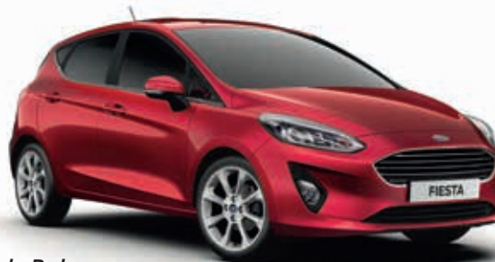
Ruby Red Lakier metalizowany specjalny 2 700,- Lakier niedostępny dla wersji Trend i SYNC Edition