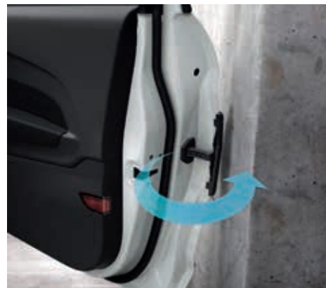
Door Edge Protector