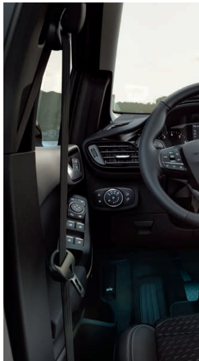
Ford Fiesta Titanium z opcjonalnym wyposażeniem

□ wyposażenie dostępne tylko w pakiecie lub z inną opcją