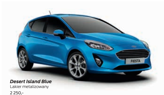
Desert Island Blue Lakier metalizowany 2 250,-