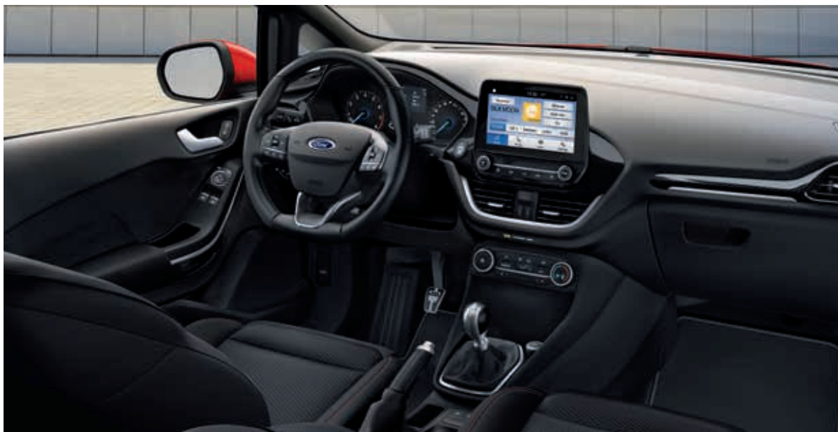
Ford Fiesta ST-Line