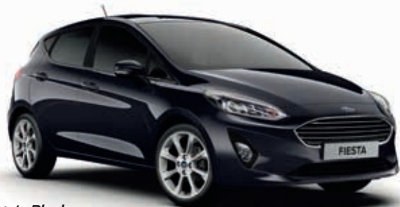
Agate Black Lakier metalizowany 1 800,-