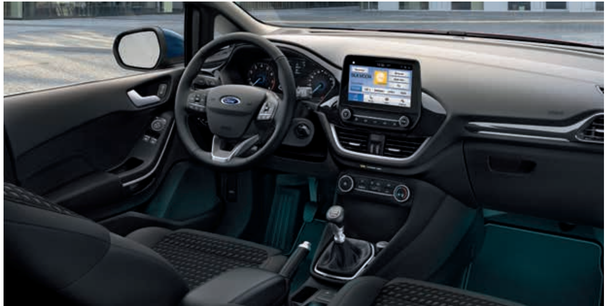
Ford Fiesta Titanium