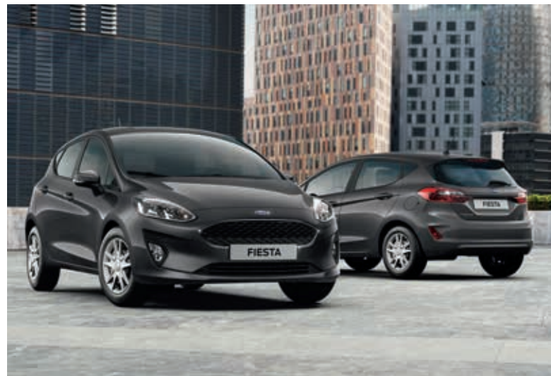
Ford Fiesta SYNC Edition w kolorze Magnetic (opcja)