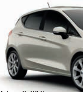
Metropolis White Lakier metalizowany specjalny 2 700,-