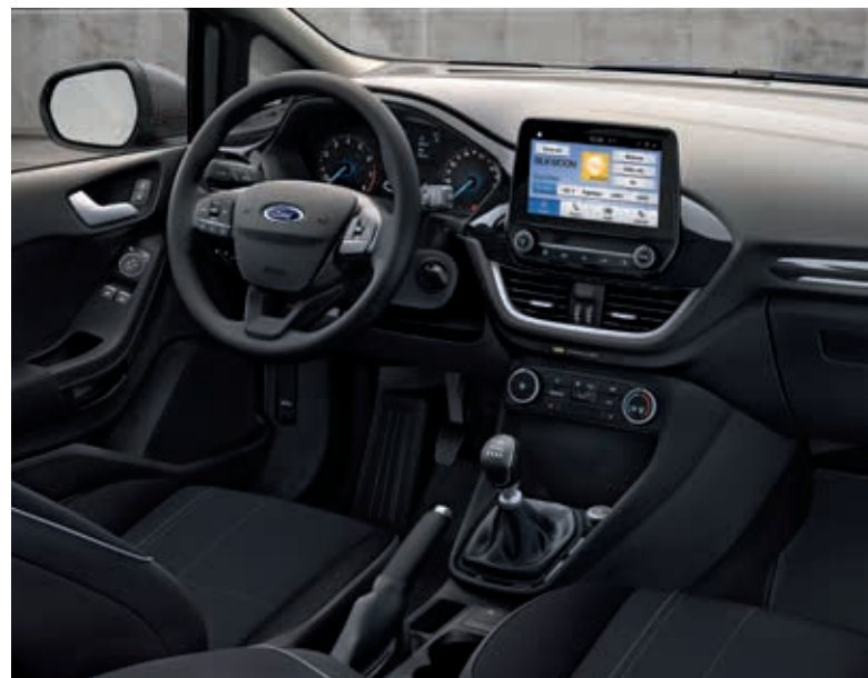
Ford Fiesta SYNC Edition