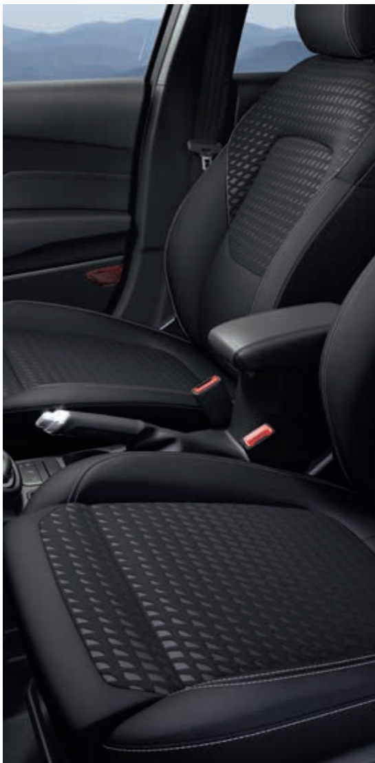
Tapicerka materiałowa Eton (12NZH)