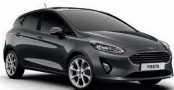
Magnetic Grey Lakier metalizowany 2 250,-