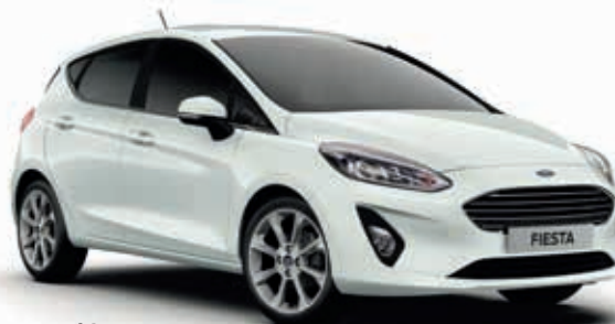
Frozen White Lakier zwykły 600,-