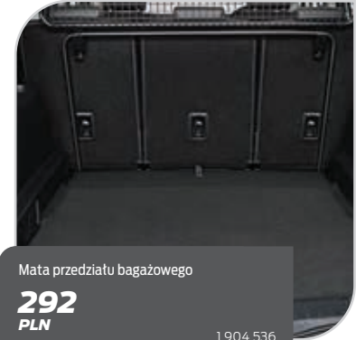
Matą przedziału bagażowego