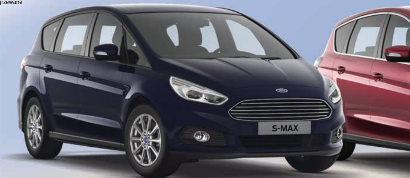
Ford S-MAX Trend w kolorze Blazer Blue (standard)