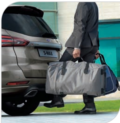
Drzwi bagażnika zamykane/otwierane elektrycznie i bezdotykowo