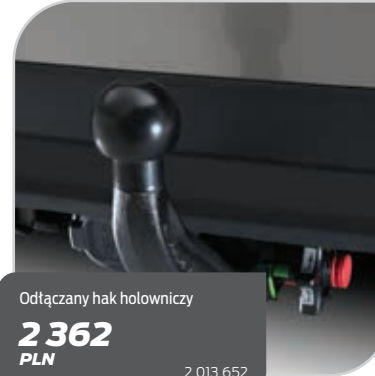
Odtączany hak holowniczy