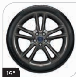
19" obręcze kół ze stopów lekkich wzór 5x2-ramienny z wykończeniem Rock Metallic (D2VBU) ogumienie 245/45