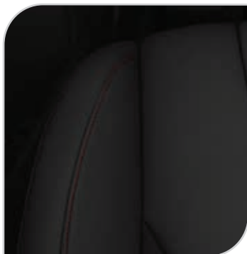
Axis (ciemna z czerwonymi przeszyciami) (90M) Tapicerka ze sportowymi fotelami wnętrze jednolite ciemne