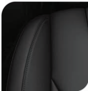
Skóra Salerno perforowana (ciemna) (90H) Tapicerka ze sportowymi fotelami wnętrze jednolite ciemne zawiera elektryczną regulację położenia przednich foteli w 8. kierunkach (fotel kierowcy z pamięcią położenia), elektrycznie składane lusterka z pamięcią położenia Opcja dostępna z fotelami wielokonturowymi z masażem lub w pakiecie Comfort 6 (AGEAG)