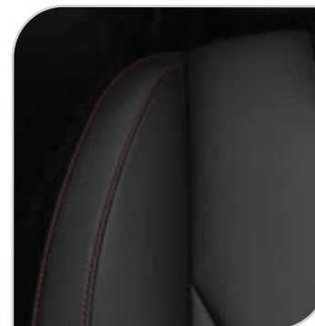
Skóra Salerno (ciemna) (90Q) Tapicerka ze sportowymi fotelami z czerwonymi przeszyciami, wnętrze jednolite ciemne zawiera elektryczną regulację położenia przednich foteli w 10. kierunkach (fotel kierowcy z pamięcią położenia), elektrycznie składane lusterka z pamięcią położenia Opcja dostępna także w pakiecie Comfort 4 Leather (AGEAE)