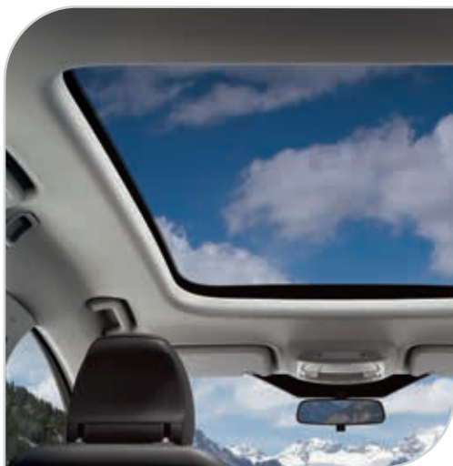
Dach panoramiczny - nieotwierany