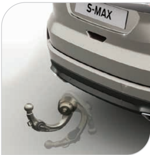
Hak holowniczy - składany elektrycznie