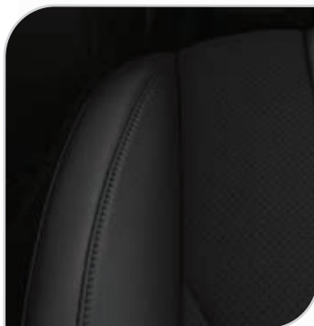
Miko Suede (ciemna) (90J) Tapicerka ze sportowymi fotelami, wnętrze jednolite ciemne zawiera elektryczną regulację położenia przednich foteli w 10. kierunkach (fotel kierowcy z pamięcią położenia), elektrycznie składane lusterka z pamięcią położenia Opcja dostępna także w pakiecie Comfort 5 (AGEAF)