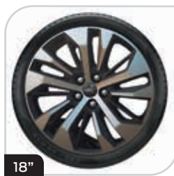
18" obręcze kół ze stopów lekkich wzór 5x3-ramienny z wykończeniem maszynowym/Matt Black (D2UDW) ogumienie 235/50