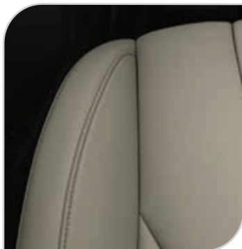
Skóra Salerno (jasna) (90G) Tapicerka ze sportowymi fotelami wnętrze jednolite ciemne zawiera elektryczną regulację położenia przednich foteli w 10. kierunkach (fotel kierowcy z pamięcią położenia), elektrycznie składane lusterka z pamięcią położenia Opcja dostępna także w pakiecie Comfort 4 Leather (AGEAE)