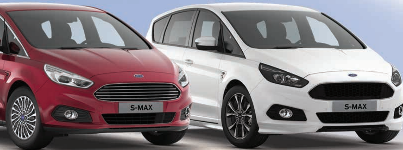
Ford S-MAX Titanium w kolorze Ruby Red (opcja)