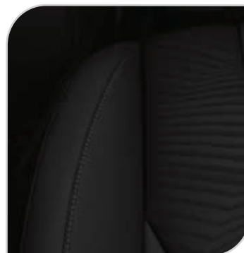
Manhattan (ciemna) (90B) Tapicerka ze sportowymi fotelami wnętrze jednolite ciemne