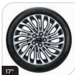
17" obręcze kół ze stopów lekkich z wykończeniem maszynowym Pearl Grey (D2YDP) ogumienie 235/55