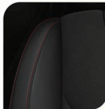
Miko Suede (ciemna z czerwonymi przeszyciami) (90N) Tapicerka ze sportowymi fotelami, wnętrze jednolite ciemne zawiera elektryczną regulację położenia przednich foteli w 10. kierunkach (fotel kierowcy z pamięcią położenia), elektrycznie składane lusterka z pamięcią położenia Opcja dostępna także w pakiecie Comfort 5 (AGEAF)