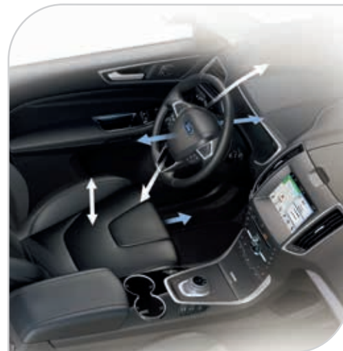
Fotele i kolumna kierownicy z elektryczną regulacją położenia