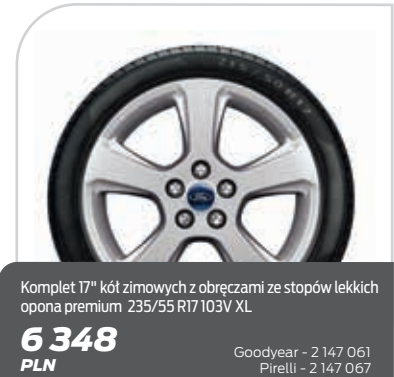
Komplet 17" kół zimowych z obręczami ze stopów lekkich opona premium 235/55 R17 103V XL