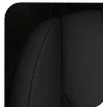
Axis (ciemna) (90D) Tapicerka ze sportowymi fotelami wnętrze jednolite ciemne