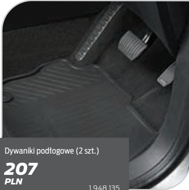
Dywaniki podłogowe (2 szt.)

Bez względu na to, czy szukasz określonego elementu do stylizacji, czy chcesz zapewnić swojemu Fordowi S-MAX ochronę lub sprawić, by prowadzenie go było prostsze i bardziej komfortowe – skorzystaj z bogatej oferty FORD AKCESORIA.