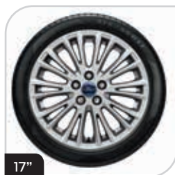
17" obręcze kół ze stopów lekkich wzór 20-ramienny (D2YCE) ogumienie 235/55