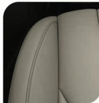
Skóra Salerno perforowana (jasna) (90I) Tapicerka ze sportowymi fotelami wnętrze jednolite ciemne zawiera elektryczną regulację położenia przednich foteli w 8. kierunkach (fotel kierowcy z pamięcią położenia), elektrycznie składane lusterka z pamięcią położenia Opcja dostępna z fotelami wielokonturowymi z masażem lub w pakiecie Comfort 6 (AGEAG)