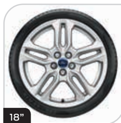
18" obręcze kół ze stopów lekkich wzór 5x2-ramienny (D2ULR) ogumienie 235/50