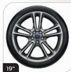
19" obręcze kół ze stopów lekkich wzór 5x2-ramienny (D2VBT) ogumienie 245/45