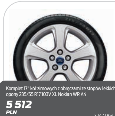
Komplet 17" kół zimowych z obręczami ze stopów lekkich opony 235/55 R17 103V XL Nokian WR A4