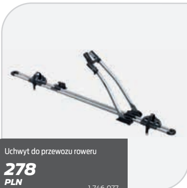
Uchwyt do przewozu roweru